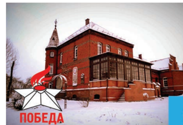
Краеведческий музей города Гусев Калининградской области, посвященный Первой мировой войне

Однако, самым большим отрицательным последствием аппаратного развития гуманитарной инициативы является размытие бюджета на фоне роста коммерческих appetitov.