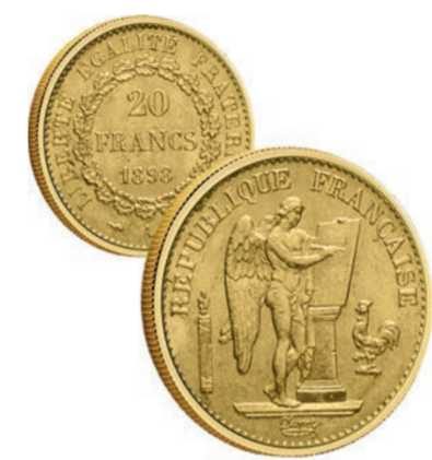
Французский Франк Ангел 20 Fr (Франция)

чительной степени вырастут, но его можно понимать и так, что они столь же чудовищно обесценятся. И не стоит особенно разочаровываться, если криптовалюта, еще вчера стоившая что-то и возможно даже много, завтра обесценится полностью. Это характерное свойство любой необеспеченной валюты, что выпускаемой центральными банками, что программистами под названием криптовалютой.